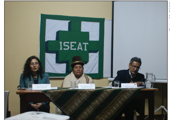
Acto de presentación del diplomado realizado el 2 de julio.

Con este diplomado, la U-PIEB y el ISEAT ya han lanzado de manera conjunta